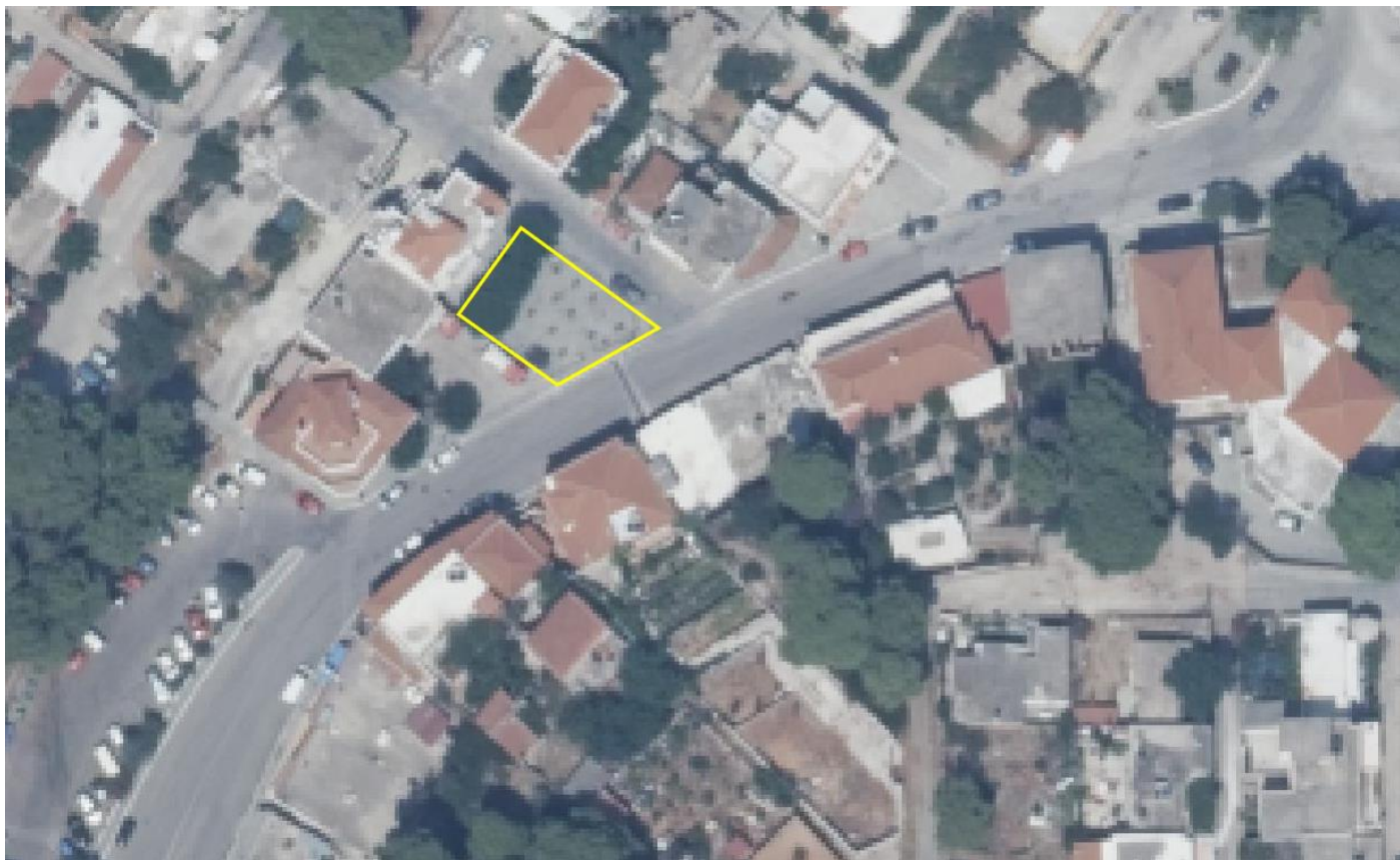
Εικόνα 1. Αεροφωτογραφία αδόμητου χώρου εντός του οδικού δικτύου του οικισμού Πατητηρίου

Κατόπιν των ανωτέρω το Δημοτικό Συμβούλιο του Δήμου Αλοννήσου καλείται να λάβει Απόφαση σχετικά με: